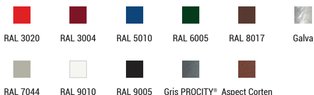
Réf. 529451 + 529455