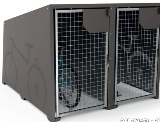
Réf. 529450 + 529454 + 529455