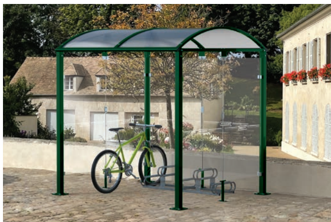
Réf. 529022 + 204719