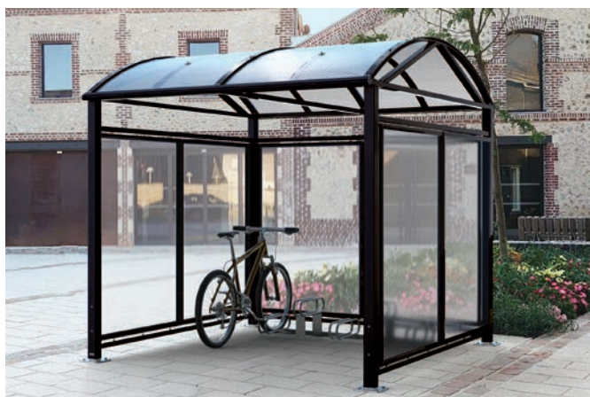
Réf. 529082 + 204719